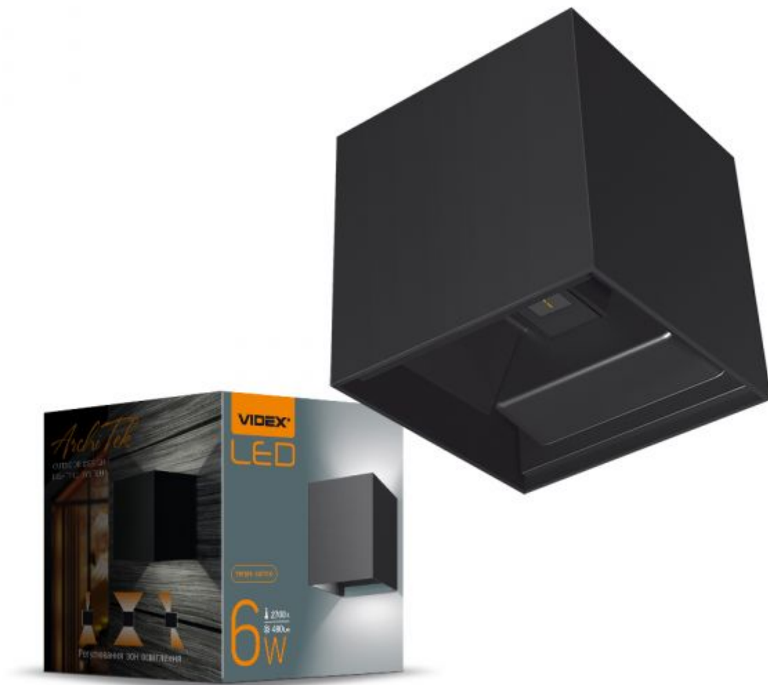
Fassade zweiseitige Leuchte