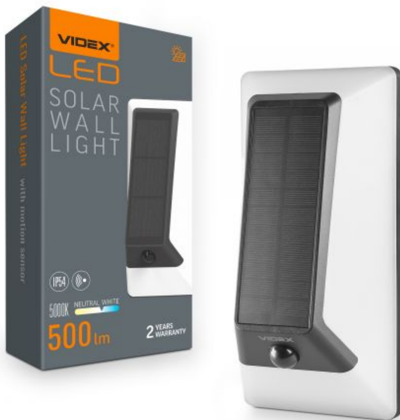
LED-SOLARWANDLEUCHE mit Bewegungssensor