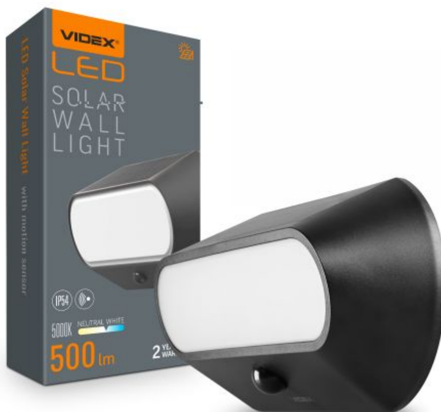
LED-SOLARWANDLEUCHE mit Bewegungssensor